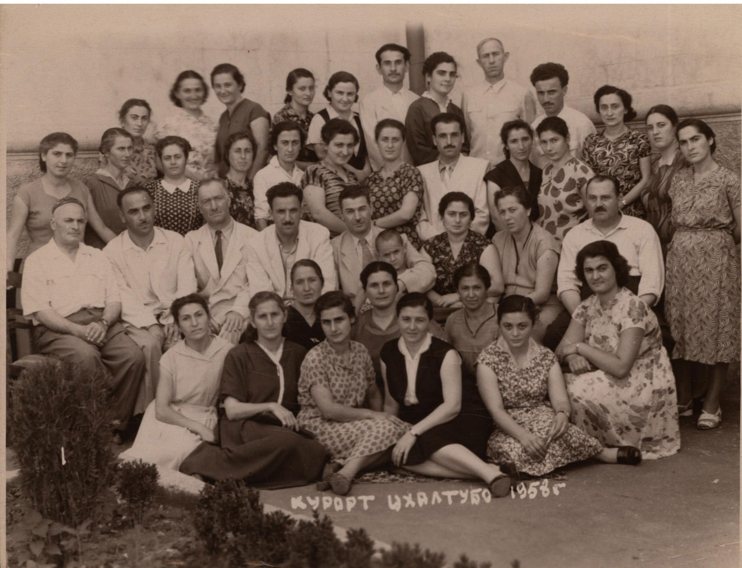
КУРОРТ ЦХАЛТУБО 1958г