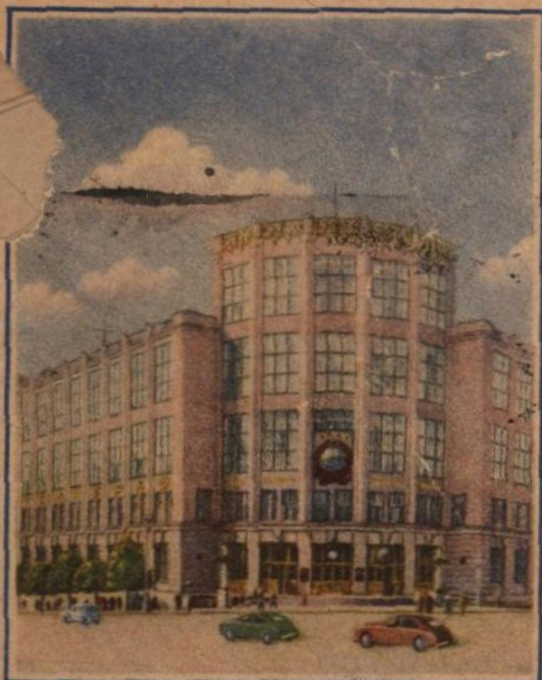
МОСКВА ЗДАНИЕ ЦЕНТРАЛЬНОГО ТЕЛЕГРАФА

Издание Министерства связи СССР. Ш 01855 14/III 1957. МПФ Гознака. Зак. 18368. Цена конверта с маркой 50 к.