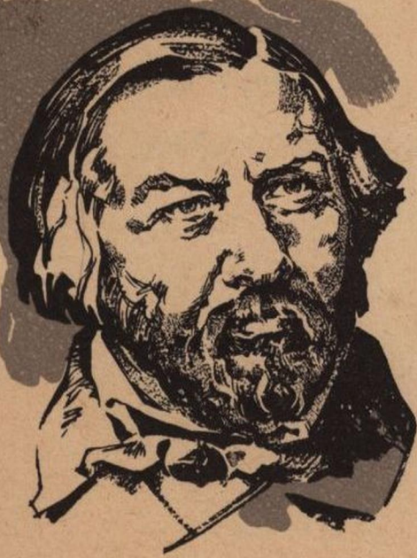
М. И. ГЛИНКА (1804—1857)