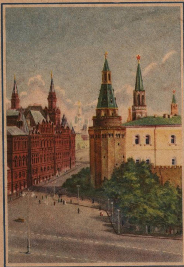
Москва. Въезд на Красную площадь

Издание Министерства Связи СССР Ш 01768 от 21/1-56 г. Москва. Цена конверта с маркой 30 к.