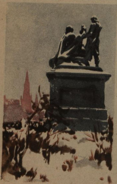
Москва. Памятник Минину и Пожарскому.