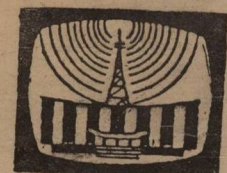
სახეზაბათი, 27 ივნისი