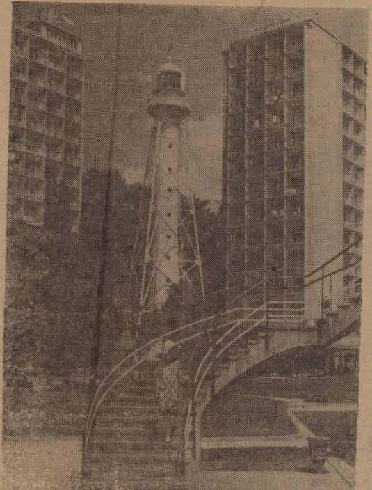
ამ სურათზე გაიხსენებთ შავი ზღვისპირეთის მშენებლებს — კურორტ ბუქინის ერთი კუთხე, სადაც მალევე კორპუსებს შორის აღმართულია შექურა.